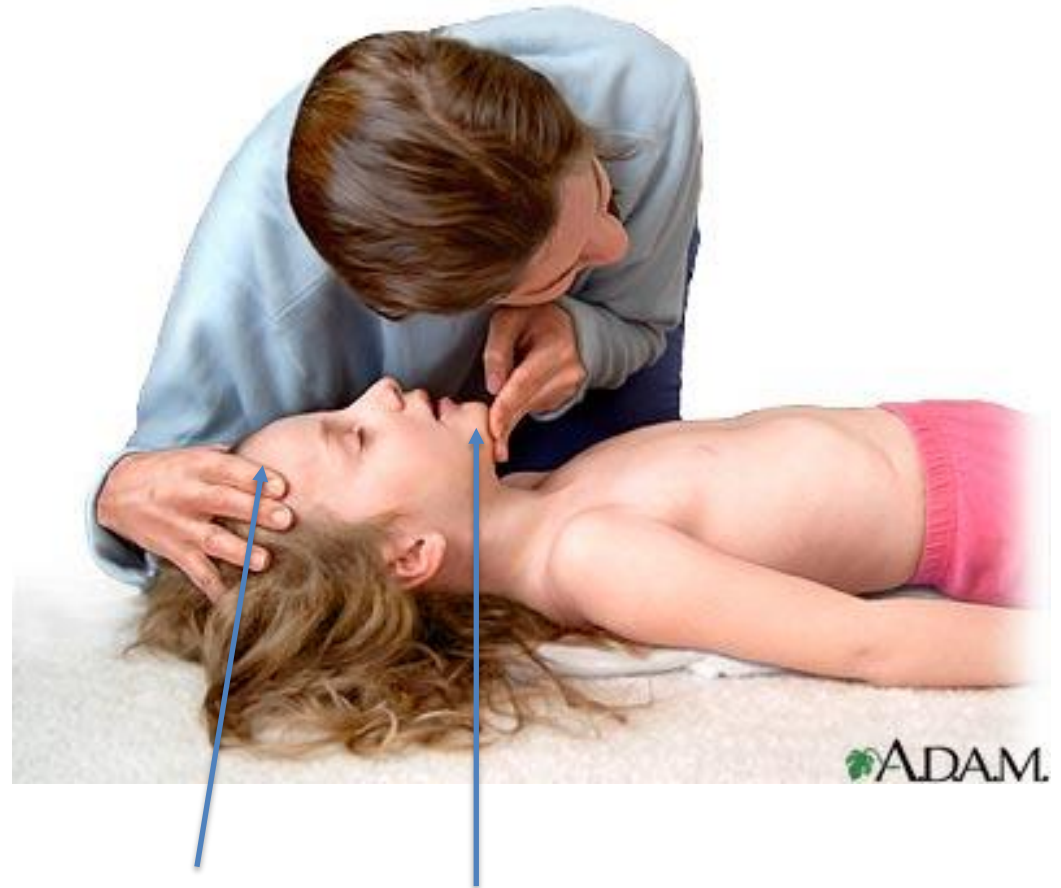
Maniobra frente mentón